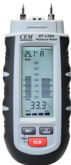
Рисунок 1 - DT-125G