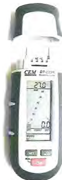
Рисунок 2 - DT-125H