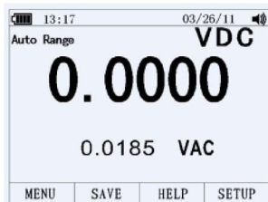
Подрежим DC AC

В режиме измерения AC– и DC–сигналов недоступны дополнительные режимы измерений: PEAK, Hz, ms, %, REL, MIN, MAX, REL .