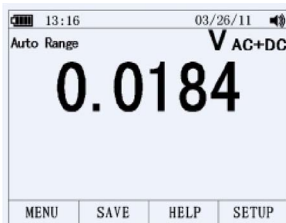
Подрежим AC + DC