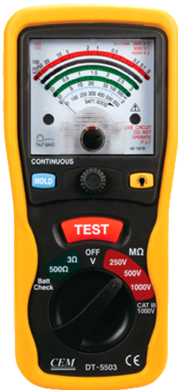
DT – 5503